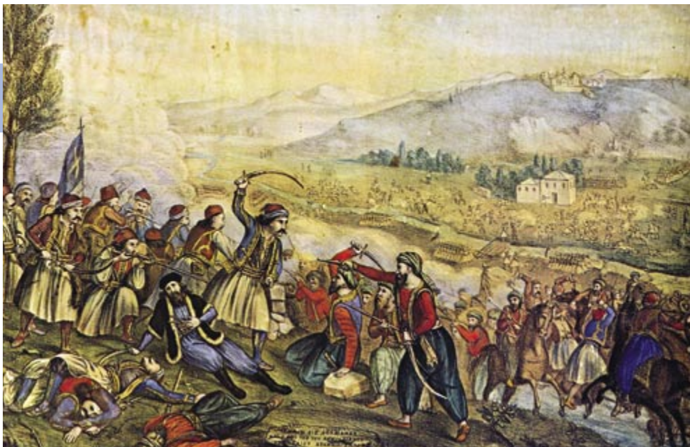
Πίνακας του Αλέξανδρου Ησαΐα εμπνευσμένος από τη μάχη της Αθαμάνας. Αθήνα, Εθνικό Ιστορικό Μουσείο

Στις 28 και 29 Μαρτίου οι επαναστάτες συγκεντρώθηκαν στα υψώματα του Προφήτη Ηλία πάνω από τη Λιβαδειά την οποία μετά από σκληρή αντίσταση της τουρκικής φρουράς απελευθέρωσαν την Παρασκευή 1 η Απριλίου 1821.