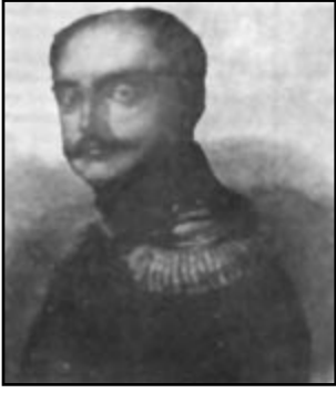
Τσάρος Νικόλαος ο Α΄

Ξεκινά ένα λυσσώδη ανταρτοπόλεμο, που φθείρει τρομερά τις δυνάμεις του Ιμπραήμ. Ταυτόχρονα ο Καραϊσκάκης, με άριστα οργανωμένο στράτευμα, συγκρατεί μεγάλο όγκο οθωμανικών στρατευμάτων στη Ρούμελη. Με στρατηγικούς αντιπερισπασμούς στη Δόμβρυνα, στο Δίστομο και στην Αράχοβα, παρενοχλεί τον τουρκικό στρατό και τον κρατά για μήνες καθηλωμένο γύρω από την Αθήνα.