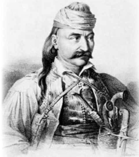
«Φωτιά και Τσεκούρι»

ϊκές δυνάμεις. Ο Άγγλος υπουργός των εξωτερικών Κάνινγκ εφάρμοσε την πάγια πολιτική της Αγγλίας: αφού δεν μπορεί να εξαφανίσει την Ελληνική Επανάσταση, θα την ποδηγετήσει και θα την κάνει όργανο των συμφερόντων της Αγγλίας. Και τους ήταν αρκετά εύκολο. Στο στρατόπεδο των επαναστατών υπήρχαν ήδη δύο αντίπαλα μέρη: από τη μια μεριά οι μπαρουτοκαπνισμένοι στρατιωτικοί και από την άλλη μεριά ο απλός λαός που πολεμούσε για ελευθερία και από την άλλη οι κοτζαμπάσηδες και οι προεστοί που επιθυμούσαν να διατηρήσουν τα προνόμια που είχαν επί τουρκοκρατίας και στο μελλοντικό ελεύθερο κράτος.