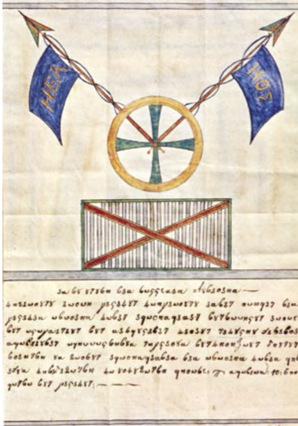
14 Σεπτεμβρίου 1814, Ίδρυση της Φιλικής Εταιρίας.

Η αντίδραση των μοναρχών της Ιερής Συμμαχίας ήταν άμεση. Ο Αλέξανδρος της Ρωσίας που επιθυμούσε να διασκεδάσει