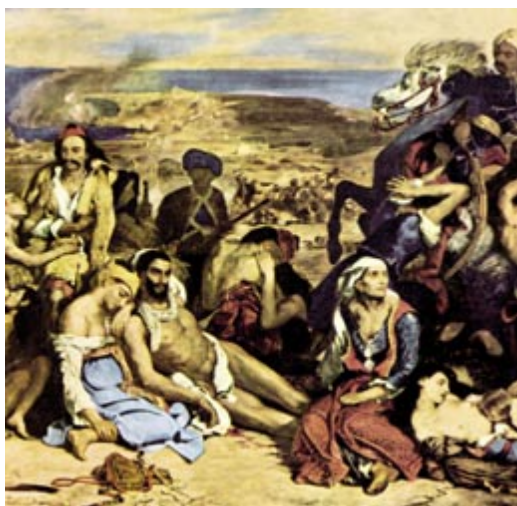
Η Καταστροφή της Χίου