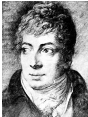
Klemens Lothar Wenrel Metternich

Όταν νικήθηκε οριστικά ο Ναπολέων, οι νικητές, οι μονάρχες της Ευρώπης και όλες οι συντηρητικές δυνάμεις, επικαλούμενες την αρχή της νομιμότητας, ξανάφεραν στους θρόνους τους όλους τους έκπτωτους βασιλιάδες και βοήθησαν για να επιβληθούν παντού απολυταρχικά, συντηρητικά και αντιδραστικά καθεστώτα. Έγινε η παλινόρθωση της Ελέω Θεού μοναρχίας σε όλη σχεδόν την Ευρώπη. Οι δυνάμεις που επικρατούσαν τώρα (η παλιά φεουδαρχία και τα ανώτερα αστικά στρώματα) συμφωνούσαν απόλυτα σ'ένα σημείο: στη δίωξη των φιλελεύθερων ιδεών. Αυτές θεωρούνταν απειλή για την κοινωνική γαλήνη, ακόμα και όταν εκδηλώνονταν ως αίτημα εθνικής απελευθέρωσης. Όσοι ενώνονταν για να διεκδικήσουν ελευθερία εθνική, όπως οι καρμπονάροι (carbonari) στην Ιταλία, ή κοινωνική δικαιοσύνη όπως οι Ιακωβίνοι, αυτοί αποτελούσαν κοινωνική απειλή. Καρμποναρισμός και ιακωβινισμός ήταν ιδέες μιάσματα και τις καταδίωκαν αμείλικτα όλες οι συντηρητικές και αντιδραστικές