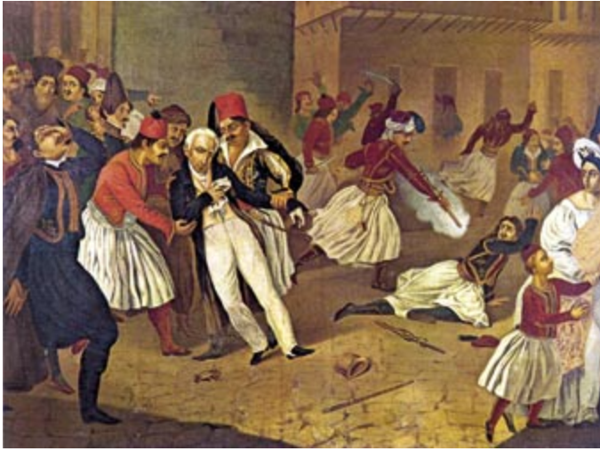
Η Δρυσ Έπεσε

Παράλληλα, η μέθοδος της αναβλητικότητας στο θέμα των συνόρων, που ακολούθησε ο Κυβερνήτης ήταν κάτι παραπάνω από πεφωτισμένη. Έθετε ως προϋπόθεση για την αποχώρηση του Ελληνικού πληθυσμού από τις επαρχίες Αιτωλίας και Ακαρνανίας την προηγούμενη αποχώρηση των Τούρκων από την Αττική και την Εύβοια, την επί τόπου παρουσία ξένων οροθετών και την εξασφάλιση αρκετών μέσων για την αντιμετώπιση του προσφυγικού ζητήματος που θα δημιουργούσε η εκκένωση των έξω από τα σύνορα περιοχών. Με αυτό τον τρόπο ματαίωνε την εκκένωση των περιοχών και εκβίαζε ουσιαστικά να δοθούν στην Ελλάδα οι αποσπώμενες περιοχές της Στερεάς. Πέτυχε έτσι να υπογραφεί το πρωτόκολλο της Διάσκεψης του Λονδίνου στις 14 Σεπτεμβρίου 1831 και να οριστούν τα σύνορα της Ελλάδας στη γραμμή Άρτας-Βόλου.