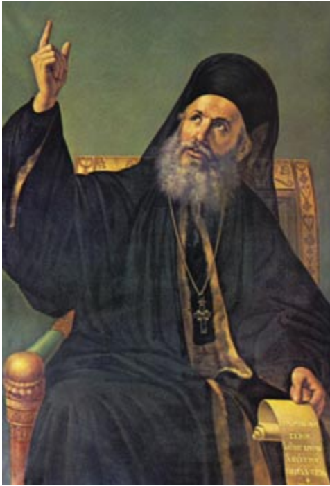
Οικουμενικός Πατριάρχης Γρηγόριος ο Ε΄

τουρκικές και κυρίως για να φροντίζουν και συντονίζουν τον Αγώνα. Μ' αυτό τον τρόπο συστήθηκαν σε σύντομο χρονικό διάστημα πλήθος τοπικές αρχές. Μερικές από αυτές τις νέες αρχές ανέλαβαν όχι μόνο την επιμελητεία αλλά και τη διπλωματική πρωτοβουλία, όπως λ.χ. το Αχαικό Διευθυντήριο και η Μεσσηνιακή Γερουσία που με προκηρύξεις προς τις ξένες δυνάμεις ζητούσαν ηθική και υλική συμπαράσταση στον αγώνα.