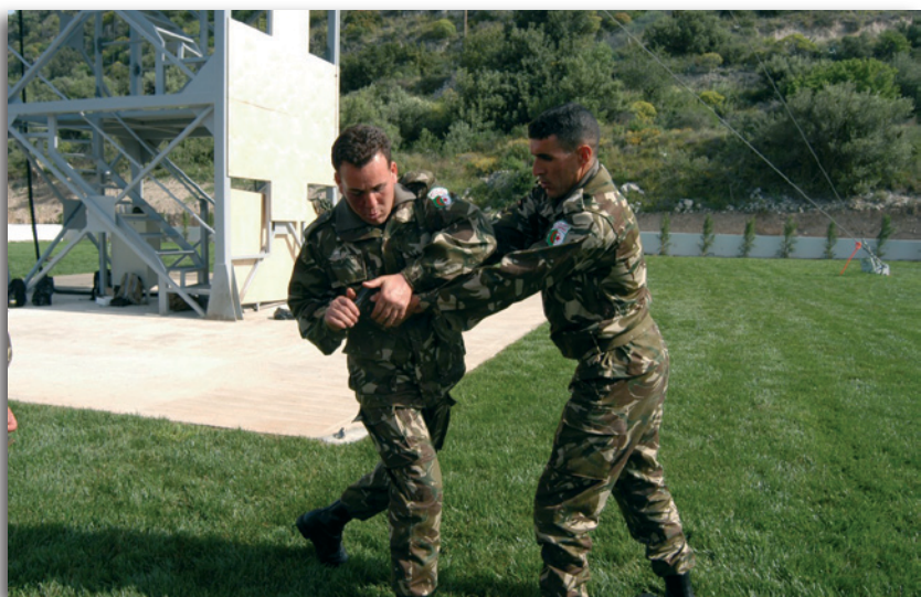
Εικόνα 4 : Εκπαίδευση σε Πολεμικές Τέχνες

• Υποστηρίζει όχι μόνον τους στόχους μετεξέλιξης του SACT, αλλά και τις απαιτήσεις εκπαίδευσης των τρεχουσών επιχειρήσεων του SACEUR (Supreme Allied Commander Europe), στο πλαίσιο των ΜΙΟ.