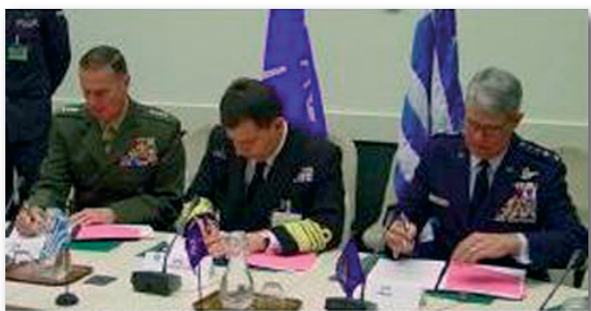
Εικόνα 2 : SACEUR - Α/ΓΕΕΘΑ - SACT κατά την Υπογραφή του Βασικού Μνημονίου