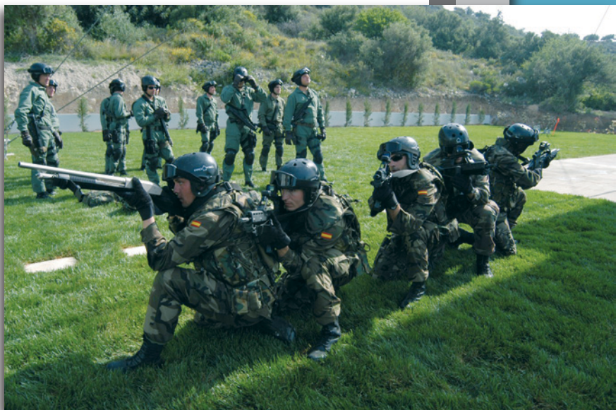
Εικόνα 1 : Εκπαίδευση Προσωπικού σε Θέματα Ασύμμετρων Απειλών

Το εκπαιδευτικό “κενό” που δημιουργήθηκε από τη νέα αυτή πραγματικότητα, έρχεται να καλύψει η ίδρυση του ΚΕΝΑΠ/ΝΜΙΟΤΣ.