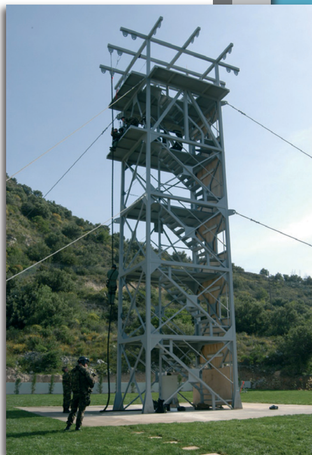
Εικόνα 16 : Πύργος Καταρρίχησης

Η οργάνωσή του περιλαμβάνει μια Ομάδα Διοικήσεως και 3 Διευθύνσεις. Η πρωτεύουσα αποστολή της Ομάδος Διοικήσεως είναι η Διοίκηση και η παροχή κατευθύνσεων στους επιτελείς του ΚΕΝΑΠ, ούτως ώστε να προάγεται το επιχειρησιακό επίπεδο της συνδυασμένης και μικτής διατιθεμένης εκπαίδευσης.