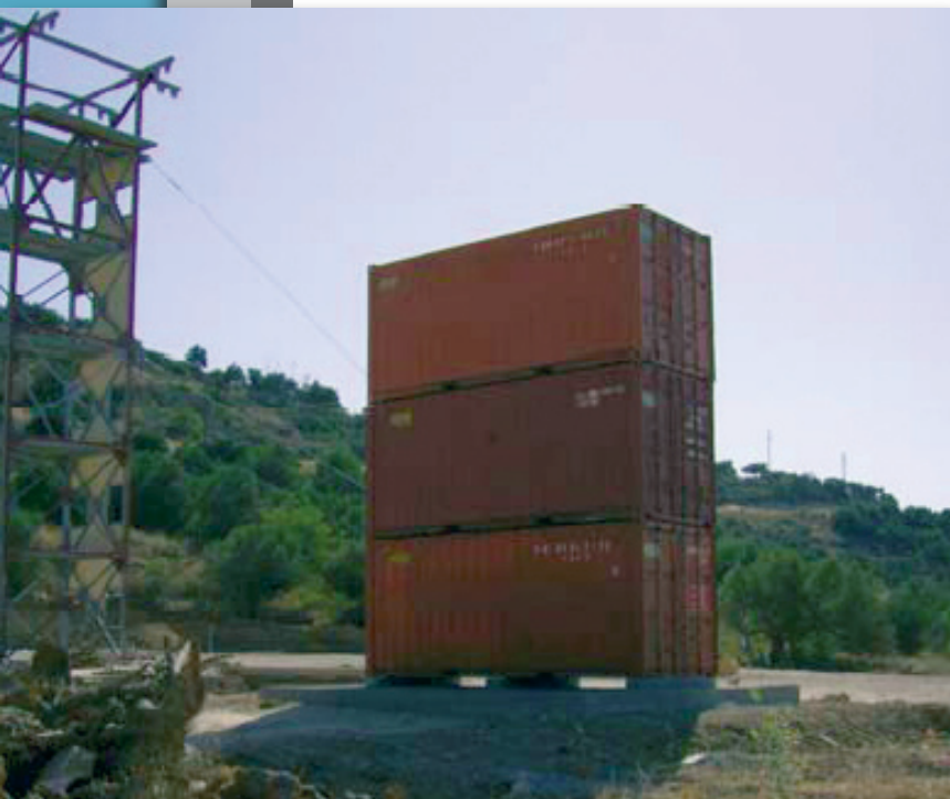
Εικόνα 14 : Containers που Χρησιμοποιούνται στην Εκπαίδευση

Διευκρινίζεται ότι, για την υποστήριξη αυτών των μαθημάτων, υπάρχει αριθμός εκπαιδευτικών μέσων όπως: του πλοίου πρακτικής εκπαίδευσής, του πύργου καταρριχίσεως, των εμπορευματοκιβωτίων, των RHIB’s (Ελαστική Λέμβος Άκαμπτης Γάστρας) και του πλοίου πρακτικής εκπαίδευσής.