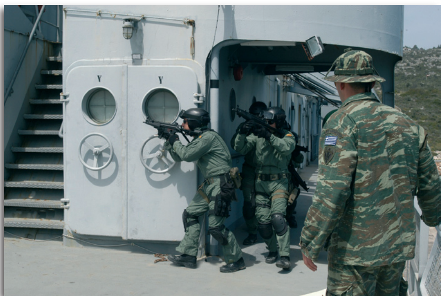
Εικόνα 18 : Τεχνικές Προώθησης Ομάδας Νηοψίας

Για τη Διεύθυνση Εκπαιδεύσεως, της οποίας προϊστάται Αντιπλοίαρχος του ΠΝ, πρωτεύουσα αποστολή είναι η βελτίωση της εξειδίκευσης στις ΜΙΟ των συμμαχικών πλοίων μέσω συγκεκριμένων εκπαιδευτικών προγραμμάτων. Η Διεύθυνση σχεδιάζει, αναπτύσσει, εκτελεί και αξιολογεί εκπαιδευτικά προγράμματα εστιασμένα στην ικανοποίηση προκαθορισμένων εκπαιδευτικών αντικειμενικών σκοπών. Επιπλέον, είναι υπεύθυνη να δοκιμάζει και να πιστοποιεί νέα δόγματα, τα οποία και τα εισάγει σε εκπαιδευτικά προγράμματα. Τέλος, είναι υπεύθυνη τόσο για την αξιολόγηση της εκπαιδευτικής αποτελεσματικότητας, όσο και για τη συνεχή βελτίωση του εκπαιδευτικού προγράμματος.