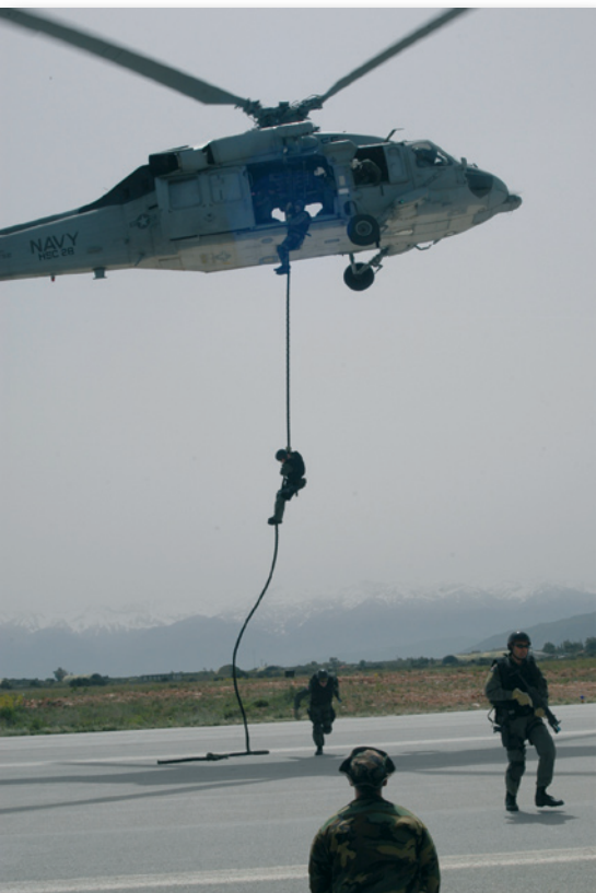
Εικόνα 17 : Καταρρίχηση από Ελικόπτερο

Για βελτίωση της ρεαλιστικότητας της εκπαίδευσης αριθμός εμπορευματοκιβωτίων είναι διαθέσιμος για την εκτέλεση του μαθήματος “Επιθεώρηση Εμπορευματοκιβωτίων”. Επιπρόσθετα για τη μεγαλύτερη εξοικείωση των εκπαιδευομένων, το ΚΕΝΑΠ διαθέτει 2 RHIBs, ειδικά εξοπλισμένα για την εκτέλεση ΜΙΟ, τα οποία χρησιμοποιούνται στο μάθημα “Διεισδύσεως και Εξαγωγής με RHIBs”.