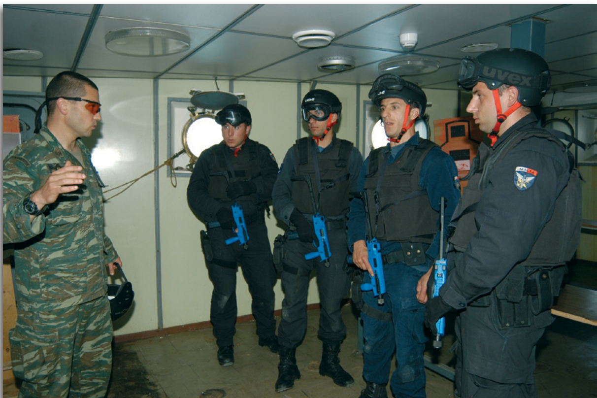
Εικόνα 21 : Απενημέρωση μετά το πέρας Νηοψίας