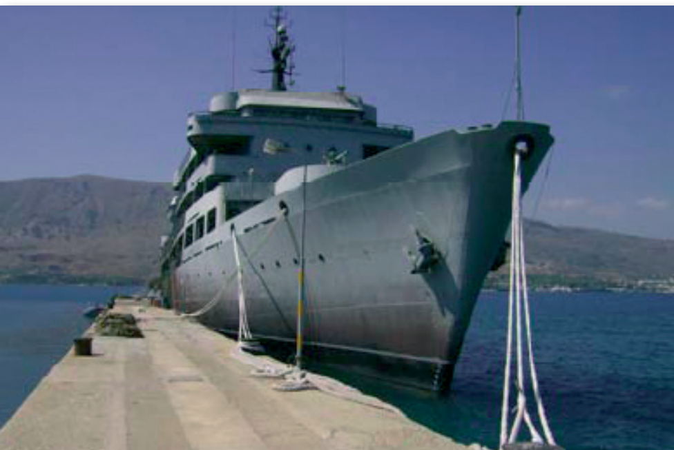
Εικόνα 15 : Πλοίο Πρακτικής Εκπαίδευσης του ΚΕΝΑΠ

Το πλοίο πρακτικής εκπαίδευσης, μόνιμα παραβελημένο πλησίον των εγκαταστάσεων του ΚΕΝΑΠ, παρέχει ένα πλήθος πρακτικών μαθημάτων (πχ Τακτική Σάρωση, Μάχη εκ του Συστάδην σε Περιορισμένο Χώρο, Μεθόδους Επιθεωρήσεως Πλοίων, Επιθεώρηση Εγγράφων και Φορτίου, κλπ) στα οποία αξιολογείται το άγημα. Για τον λόγο αυτό το πρώην εκπαιδευτικό “ΑΡΗΣ” μετασκευάστηκε αναλόγως.