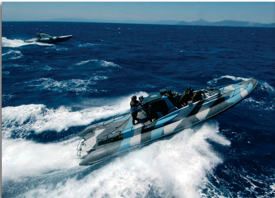
Εικόνα 13 : Ελαστική Λέμβος κατά τη Διάρκεια Εκπαίδευσης

Πρωταρχικής σημασίας στην όλη εκπαίδευση αποτελεί η εκτίμηση του βαθμού επικινδυνότητας (Risk Assessment – RA). Η εκτίμηση αυτή είναι σημαντική προκειμένου τα επιτελεία που προτείνουν τη συμμετοχή στα σχολεία των εκπαιδευομένων της χώρας τους, να γνωρίζουν τους εκτιμώμενους κινδύνους της εκπαίδευσής αυτής. Με το δεδομένο ότι, οι εκπαιδευόμενοι στο ΚΕΝΑΠ, είναι κυρίως πολυεθνικοί αλλά και διακλαδικοί, είναι απαραίτητο να ακολουθείται η θέσπιση αυστηρών και σαφών κριτηρίων ασφαλείας.