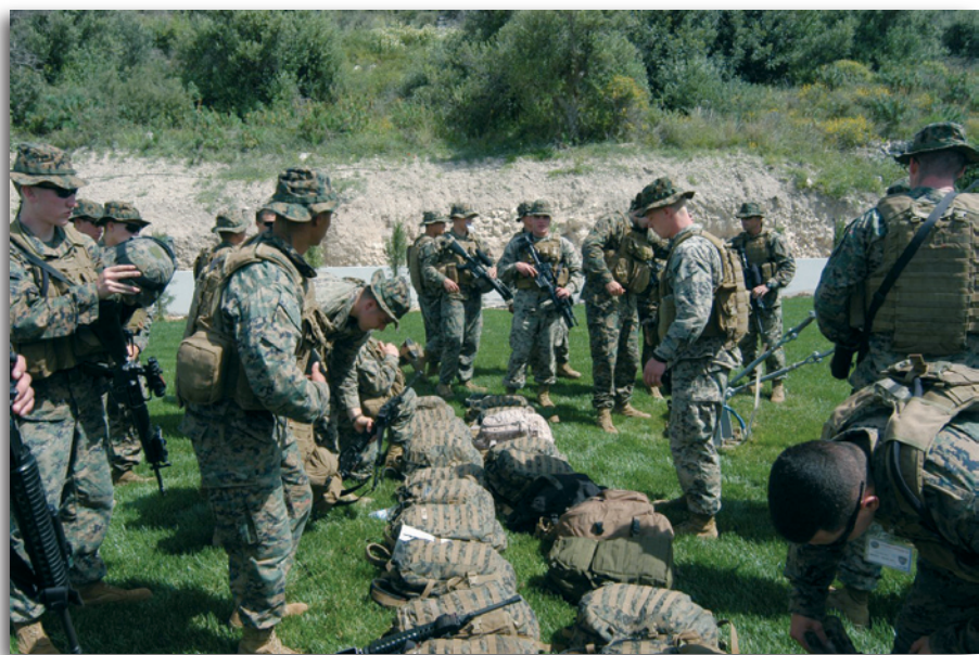
Εικόνα 19 : Έλεγχος Εξοπλισμού πριν την Έναρξη Γυμνασίου

Το ΚΕΝΑΠ συνδέεται/υπάγεται στο SACT με τον ίδιο ακριβώς τρόπο όπως όλα τα λοιπά εκπαιδευτικά ιδρύματα /ευκολίες τα οποία έχουν εκχωρηθεί στο ΝΑΤΟ (“NDC”, “NS”, “NCISS”). Συνεργάζεται στενά με το επιτελείο του SACT, έχει δεσμούς με “JWC” (Joint Warfare Center), “JALLC” (Joint Analysis & Lessons Learned Center) και “JFTC” (Joint Forces Training Centre), τις υποτεταγμένες στο SACT υπηρεσίες, καθώς και τις υποτεταγμένες στο SACEUR Διοικήσεις.