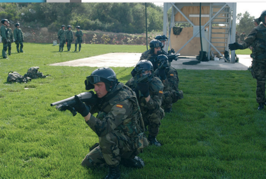
Εικόνα 3 : Εκπαίδευση Προσωπικού σε Θέματα Ασύμμετρων Απειλών

• Είναι αναγνωρισμένο κέντρο εκπαίδευσης του ΝΑΤΟ.