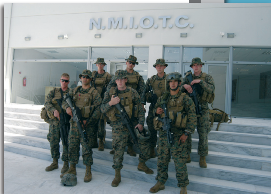
Εικόνα 11 : Εκπαιδευόμενοι στο ΚΕΝΑΠ

Στη διάρκεια της φάσης αυτής, οι εκπαιδευόμενοι ενημερώνονται για το ισχύον “NATOϊκό δόγμα” εκτέλεσης “ΜΙΟ”. Οι εκπαιδευόμενοι εξετάζονται/ πιστοποιούνται αφενός ως προς την γνώση των κανόνων/διατάξεων ασφαλείας και αφ’ ετέρου επί αυτού καθ’ εαυτού του “δόγματος”.