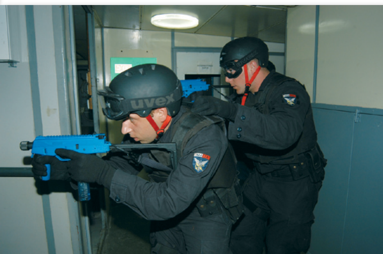
Εικόνα 12 : Εκπαίδευση σε Εσωτερικό Χώρο Πλοίου