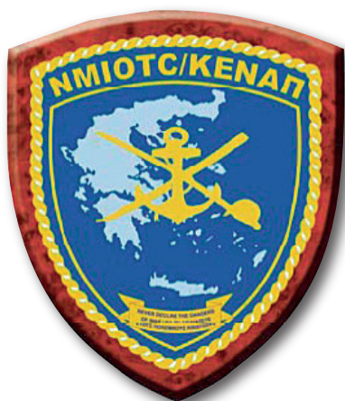
Εικόνα 7 : Θυρεός ΚΕΝΑΠ