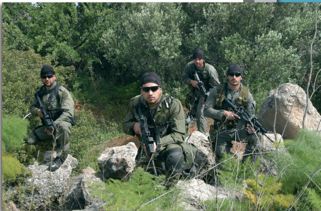
Εικόνα 20 : Εκπαίδευση σε συνθήκες Ασύμμετρων Απειλών

• Η παρεχόμενη από το Κέντρο εκπαίδευση πρέπει να θεωρείται ως "απαραίτητη" και όχι ως "επιθυμητή".