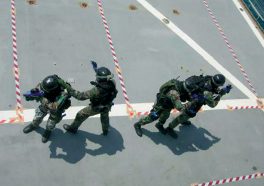
Εικόνα 10 : Ανάπτυξη Ομάδος κατά τη Διεξαγωγή Νηοψίας

Επιπλέον ιδιαίτερα σημαντική και τιμητική για το Κέντρο, θεωρείται η ανάληψη της ευθύνης υλοποίησης, του σχολείου Επιχειρησιακής Ναυτικής Ορολογίας (Maritime Operational Language Course). Το σχολείο αυτό, ελεγχόμενο από τον SACT, απευθύνεται κυρίως σε μη-NATOϊκό προσωπικό και ουσιαστικά μεταφέρει τις γνώσεις ορολογίας που είναι απαραίτητες, προκειμένου να είναι δυνατή η συμμετοχή σε συνδυασμένες ναυτικές επιχειρήσεις/ασκήσεις στο πλαίσιο του NATO. Το σχολείο εκτελείται σε ετήσια βάση.