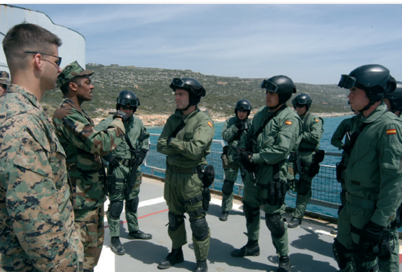
Εικόνα 5 : Απενημέρωση μετά τη Νηοψία