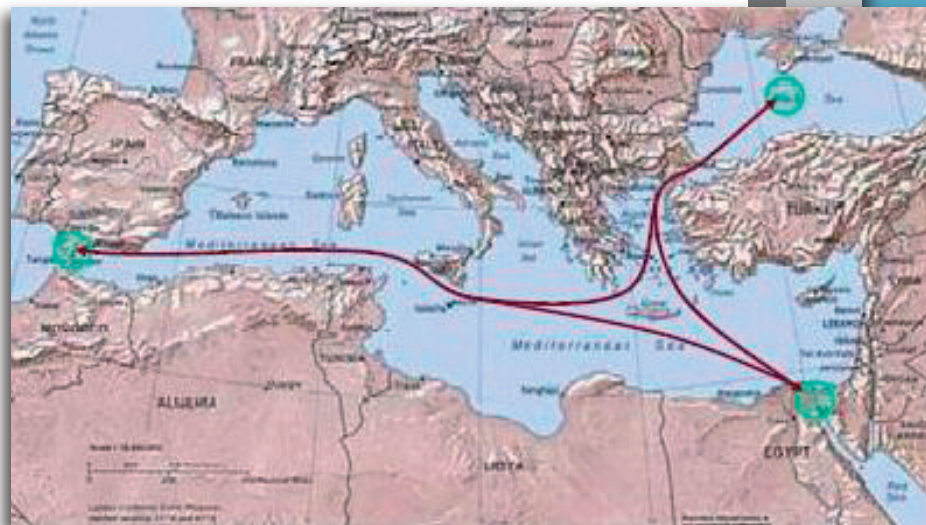
Εικόνα 6 : Γεωστρατηγική Θέση ΚΕΝΑΠ

Η τοποθεσία που επελέγη να φιλοξενήσει το ΚΕΝΑΠ είναι ο Ναύσταθμος Σούδας. Ο όρμος της Σούδας έχει διαχρονικά αποδείξει τη στρατηγική του αξία, ενώ εξυπηρετεί, από πάσης απόψεως, πολλά συμμαχικά πλοία σε τρέχουσες επιχειρήσεις. Επιπλέον επισημαίνεται ότι, η πληθώρα των παρεχομένων ευκολιών από τον Ναύσταθμο της Σούδας, καθιστούν τη χρήση του αναπόφευκτη και αδιαφιλονίκητη.