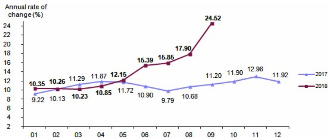
Διάγραμμα 3. Δείκτης τιμών καταναλωτή, % ετήσιας μεταβολής [2003=100]