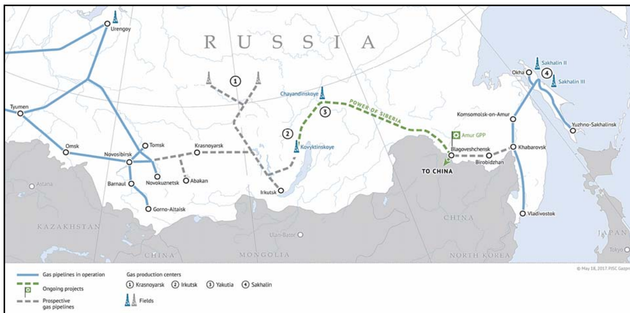
Χάρτης 1. Η πορεία του αγωγού Power of Siberia, http://www.gazprom.com/press/news/2018/may/article429502/

Στον αντίποδα των ανακοινώσεων της Αμερικανικής Υπηρεσίας Πληροφοριών Ενέργειας (EIA) για εξαπλασιασμό των αμερικανικών εξαγωγών LNG προς την Κίνα το 2017, η ρωσική Gazprom με πρόσφατη ανακοίνωση της ενημέρωσε ότι ο αγωγός “Power of Siberia” ο οποίος είναι σχεδιασμένος για να μεταφέρει ρωσικό φυσικό αέριο στα βορειοανατολικά σύνορα της Κίνας έχει ολοκληρωθεί στο 83% της διαδρομής του. 208 Ο αγωγός, που θα μεταφέρει περισσότερα από 60 δις κυβικά μέτρα φυσικού αερίου το χρόνο, αναμένεται να έχει ολοκληρωθεί έως τα τέλη του 2019 καλύπτοντας από μόνος του περισσότερο από το 15% των ετήσιων αναγκών της Κίνας σε φυσικό αέριο.