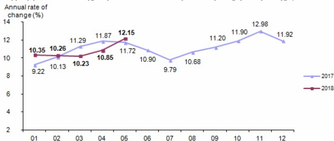
Διάγραμμα 2. Δείκτης τιμών καταναλωτή, % ετήσιας μεταβολής (2003=100)