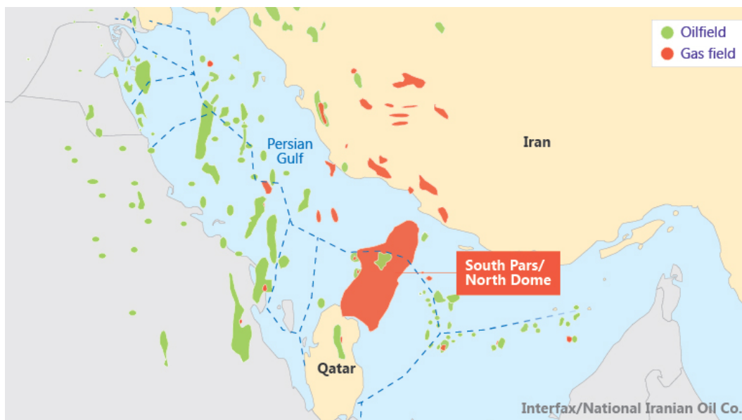
Χάρτης 1: Το κοιτάσμα South Pars/North Dome

2005 η Ντόχα είχε προχωρήσει οικειοθελώς σε μορατόριουμ εξόρυξης φυσικού αερίου από το κοιτάσμα North Field προκειμένου να ερευνησει περαιτέρω τις δυνατότητες του και να διασφαλίσει την παραγωγικότητα του για το μέλλον.