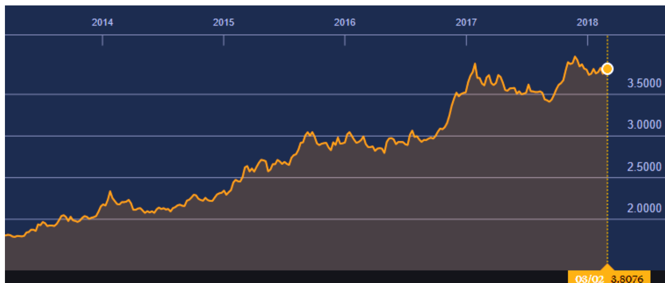
Διάγραμμα 3. Πορεία συναλλαγματικής ισοτιμίας Τουρκικής λίρας έναντι δολαρίου κατά τη τελευταία 5-ετία