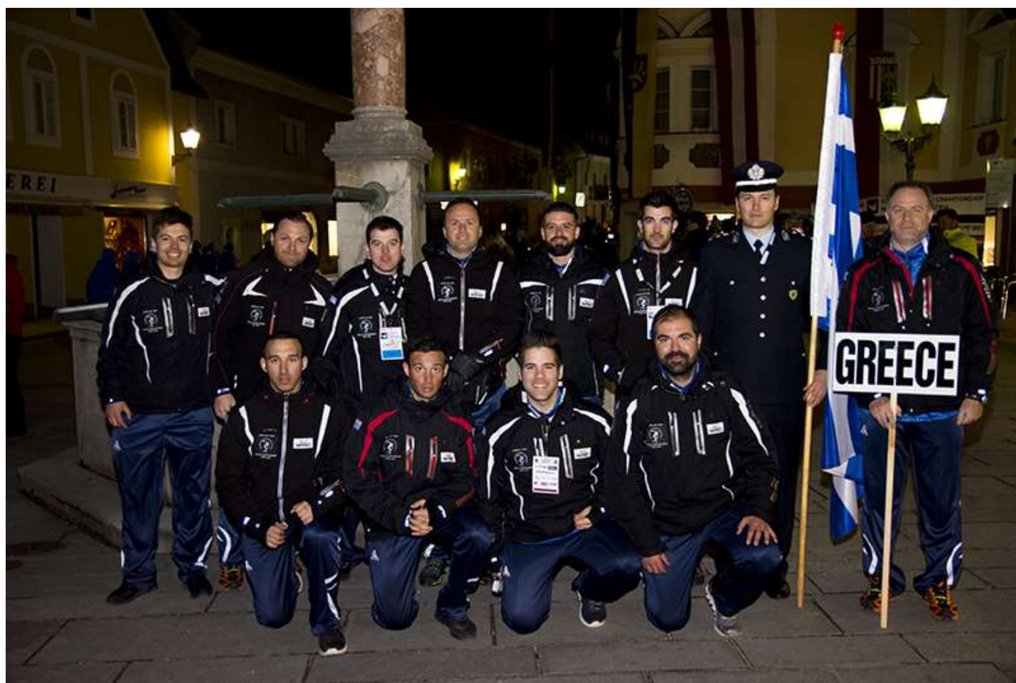
Η ομάδα Χιονοδρομίας της ΕΛ.ΑΣ συμμετείχε στο 14 ο Ευρωπαϊκό Πρωτάθλημα Αστυνομικών