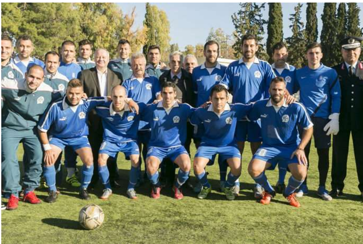
Η ομάδα ποδοσφαίρου της ΕΛ.ΑΣ που συμμετείχε σε φιλικό αγώνα με τη μικτή ομάδα δημοσιογράφων της ΕΡΤ & καλλιτεχνών για τη στήριξη παιδιών του Θεραπευτικού Προγράμματος ΚΕΘΕΑ ΔΙΑΒΑΣΗ

Στον αγώνα παρευρέθηκαν από πλευράς Πολιτικής και Φυσικής Ηγεσίας της Ελληνικής Αστυνομίας, ο Αναπληρωτής Υπουργός Προστασίας του Πολίτη, Νίκος ΤΟΣΚΑΣ, η Βουλευτής κα Άννα ΚΑΡΑΜΑΝΛΗ, ο Βουλευτής κ. Γιώργος ΜΑΥΡΩΤΑΣ, ο Γενικός Γραμματέας Δημόσιας Τάξης, Δημήτρης ΑΝΑΓΝΩΣΤΑΚΗΣ, ο Αρχηγός της Ελληνικής Αστυνομίας, Αντιστράτηγος Κωνσταντίνος ΤΣΟΥΒΑΛΑΣ, ο Προϊστάμενος του Κλάδου Διοικητικής Υποστήριξης και Ανθρώπινου Δυναμικού, Υποστράτηγος Ανδρέας ΔΑΣΚΑΛΑΚΗΣ, ο Δ/ντης της Διεύθυνσης Επικοινωνίας της Ελληνικής Αστυνομίας, ΓΕΡΟΧΡΗΣΤΟΣ Αλέξανδρος ο Πρόεδρος των SPECIAL OLYMPICS κ. ΚΟΔΕΛΛΑΣ Διονύσιος και ο πρώην Υπαρχηγός της Ελληνικής Αστυνομίας, Αντιστράτηγος (ε.α) ΡΑΧΩΒΙΤΣΑΣ Ιωάννης.