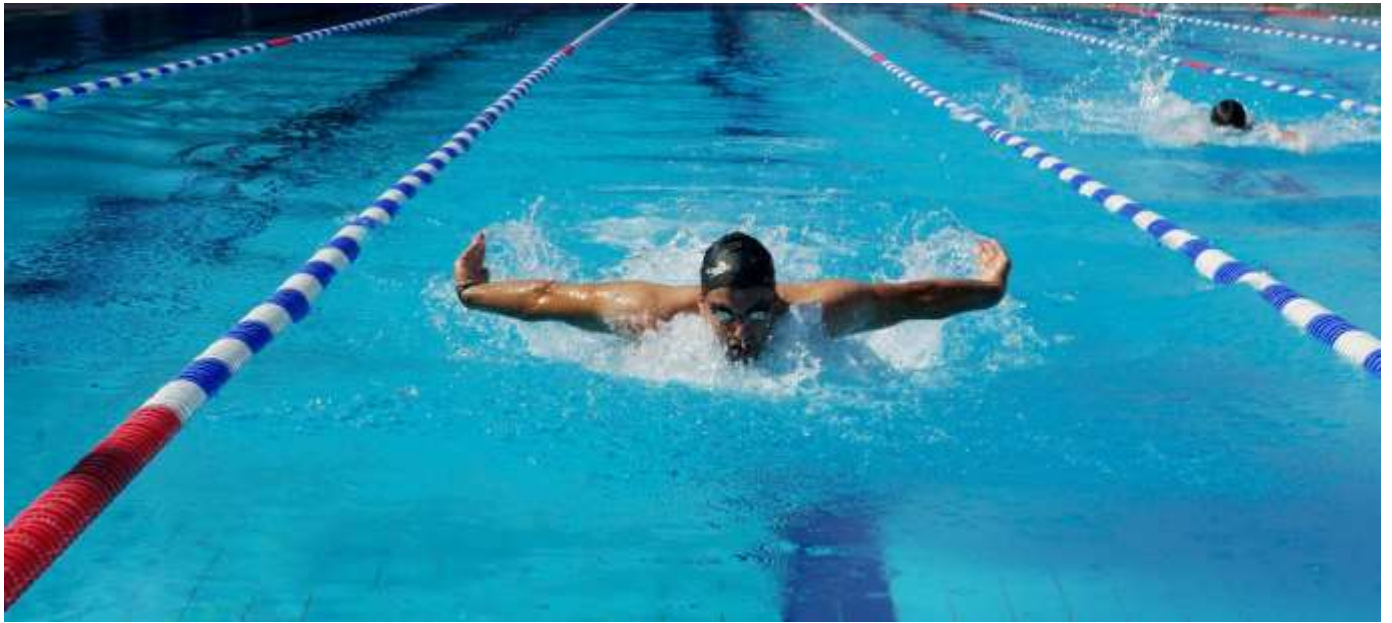
Φωτογραφίες των αγώνων των πρωταθλημάτων Κολύμβησης και Ποδηλασίας των ΕΔ & των ΣΑ 2017