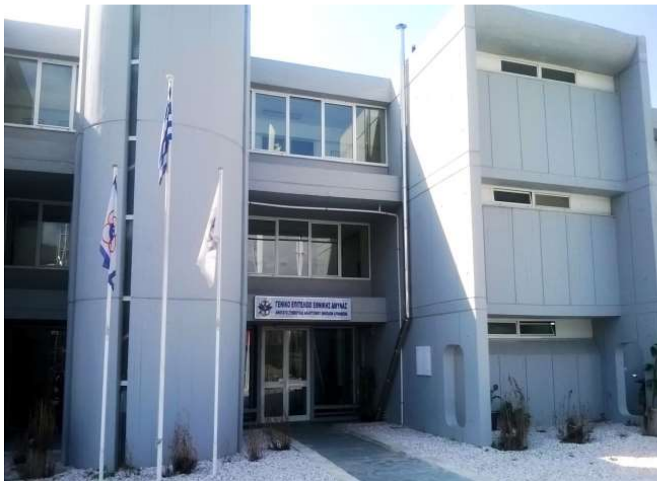
Εγκαταστάσεις Γραμματείας ΑΣΑΕΔ (κτήριο Γ΄ ΟΑΚΑ)