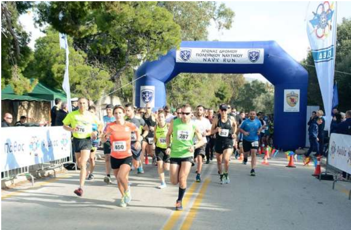
Φωτογραφίες Αγώνα Δρόμου Πολεμικού Ναυτικού – Navy Run 2017