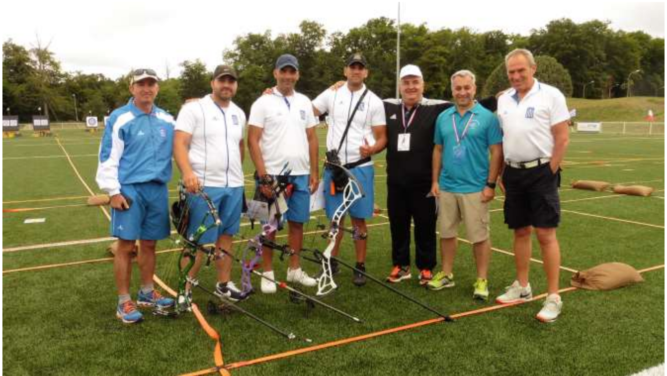
Φωτογραφίες από το Παγκόσμιο Στρατιωτικό Πρωτάθλημα Τοξοβολίας του CISM 2017