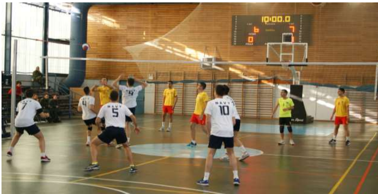
Φωτογραφίες των μικτών αγώνων Πετοσφαίρισης μεταξύ των Στρατιωτικών Ακαδημιών των Κλάδων των ΕΔ Ελλάδος – Τουρκίας ΜΟΕ 2017

Την πρώτη θέση κατέλαβε η μικτή ομάδα της Ακαδημίας του Στρατού, τη δεύτερη θέση η ομάδα της Ακαδημίας του Ναυτικού και τρίτη κατετάγη η ομάδα της Ακαδημίας της Αεροπορίας.