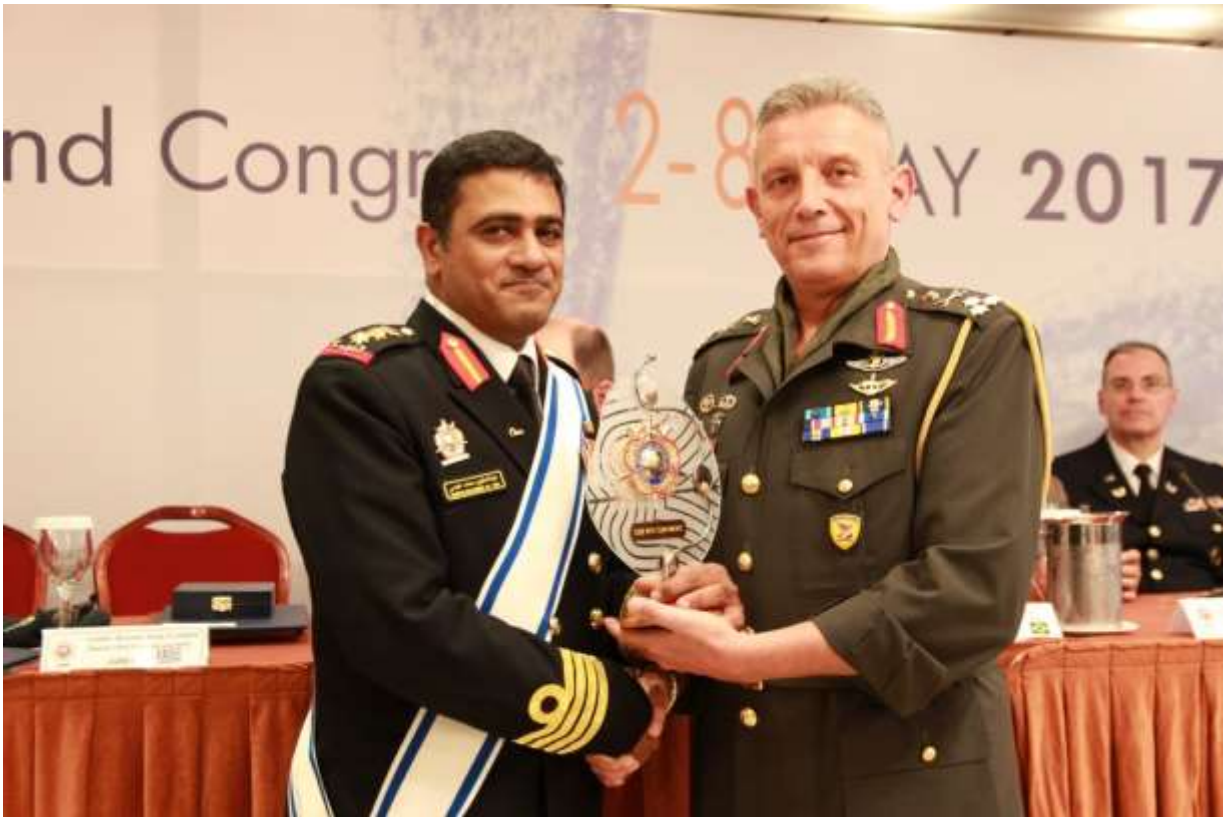
Φωτογραφίες 72ης Γενικής Συνέλευσης & Συνεδρίου CISM