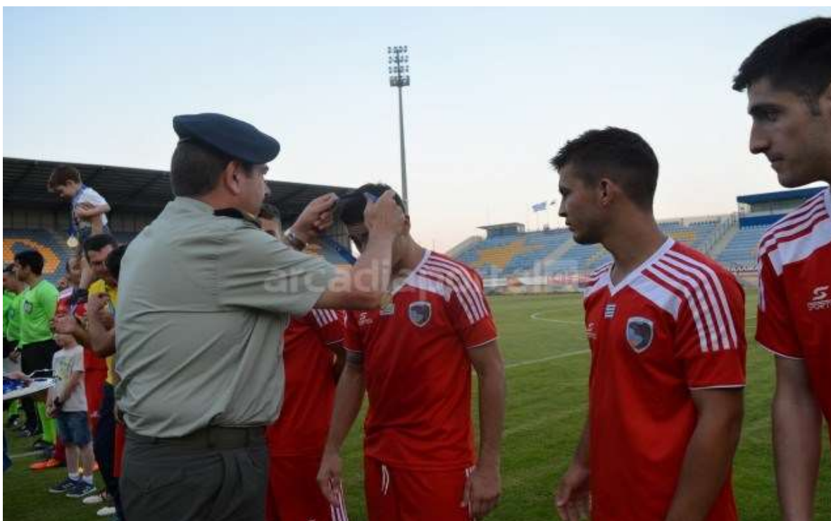
Απονομή επάθλων στην ομάδα της 124 ΠΒΕ που κατέκτησε την 1 η θέση στον τελικό αγώνα του Διακλαδικού Πρωταθλήματος Ποδοσφαίρου των Μονάδων & Υπηρεσιών των ΕΔ έτους 2017