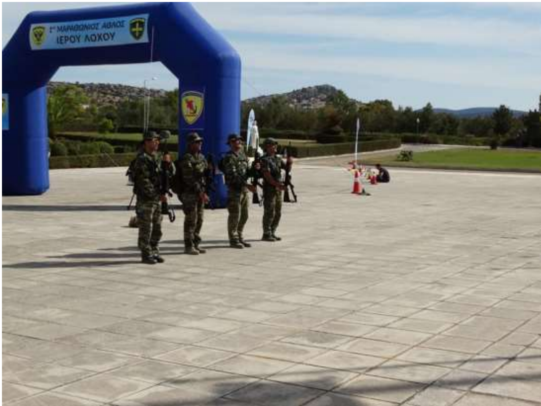
1ος Μαραθώνιος Άθλος Ιερού Λόχου