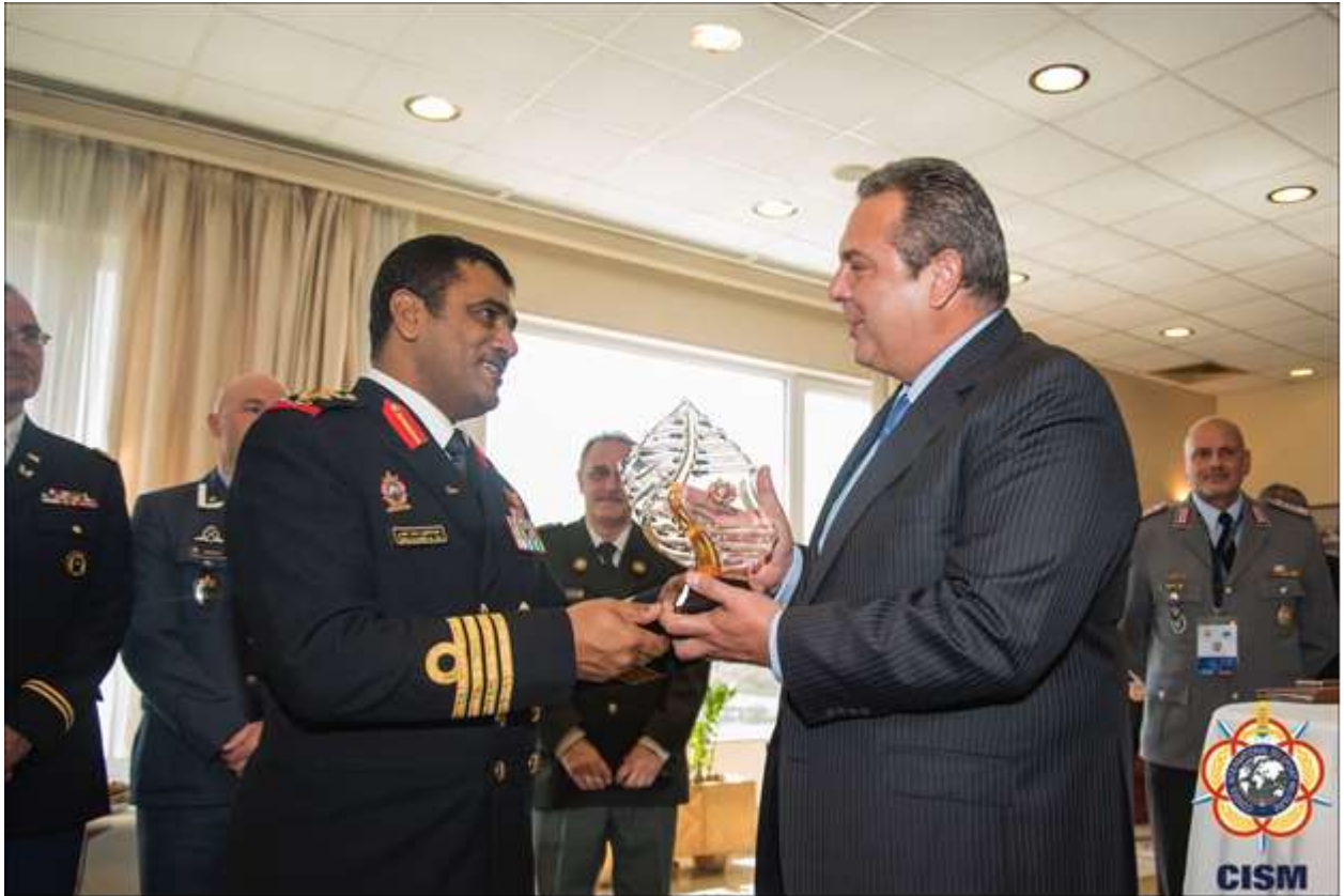
Φωτογραφίες από την οργάνωση της 72 ης Γενικής Συνέλευσης – Συνεδρίου CISM 2017 που πραγματοποιήθηκε στην Αθήνα