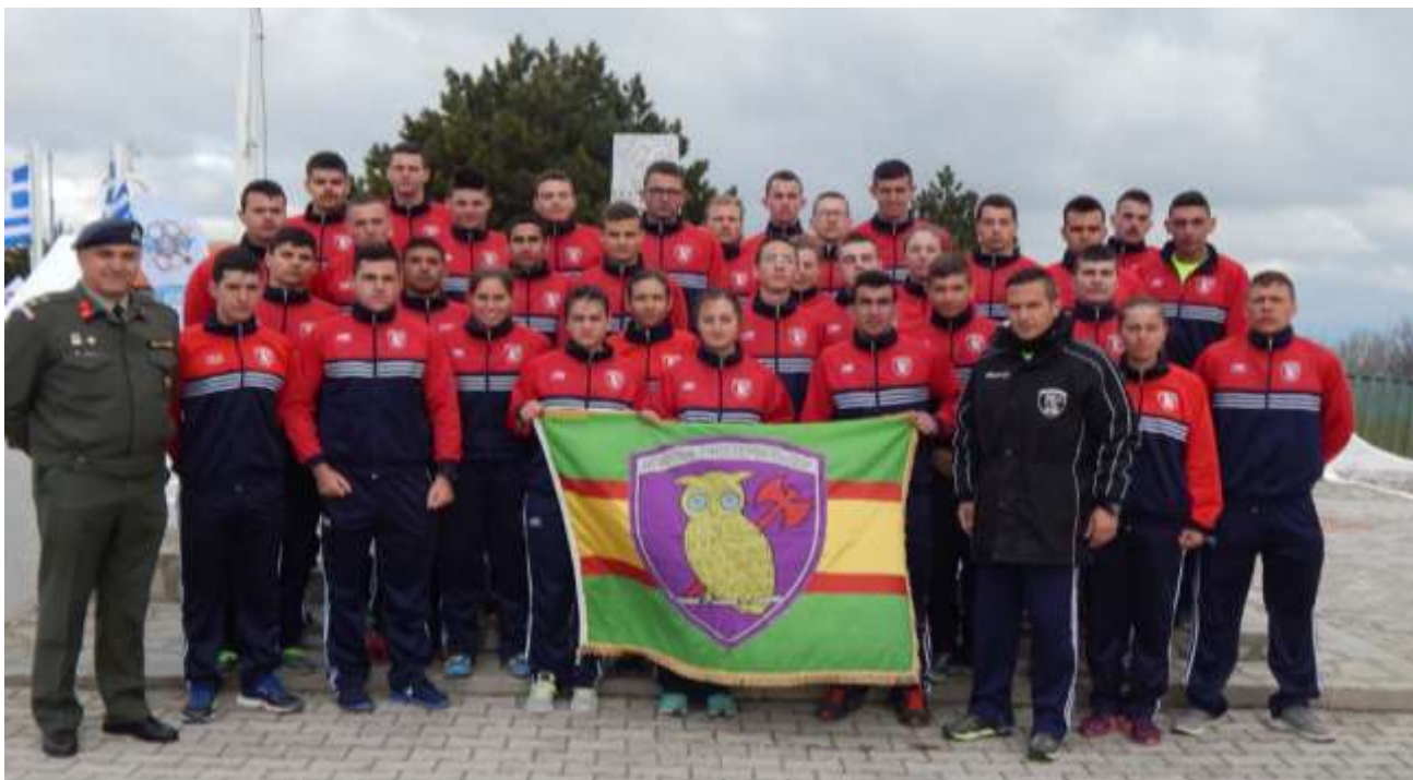
Συμμετοχή ομάδας της ΣΜΥ σε αγώνες δρόμων που πραγματοποιήθηκαν από το ΑΣΑΕΔ κατά το έτος 2017

Συμμετοχή της ομάδας Ποδοσφαίρου της Σχολής αποτελούμενη από 18 σπουδαστές σε φιλικό τουρνουά με αντιπροσωπευτικές ομάδες τοπικών φορέων και συλλογών με άριστα αποτελέσματα.