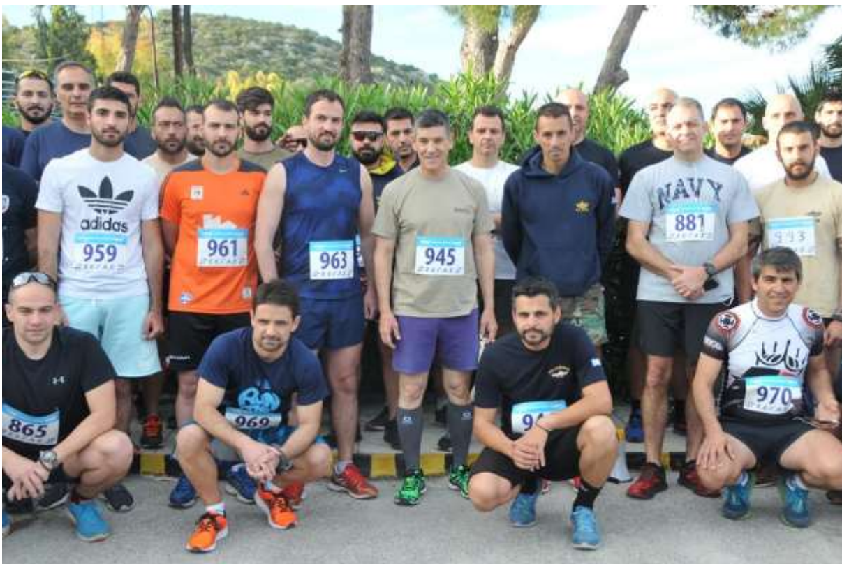
Φωτογραφίες 1 ου Ημιμαραθωνίου Δρόμου Περιβάλλον & Ένοπλες Δυνάμεις 2017

Αρχηγός Στόλου Αντιναύαρχος Ιωάννης Παυλόπουλος ΠΝ, ο οποίος αφού τερμάτισε τον αγώνα απένειμε τα έπαθλα στους νικητές του αγώνα, ως εκπρόσωπος του Αρχηγού του ΓΕΝ, καθώς επίσης και εκπρόσωποι των Γενικών Επιτελείων των Κλάδων των Ενόπλων Δυνάμεων και των Αρχηγείων των Σωμάτων Ασφαλείας.