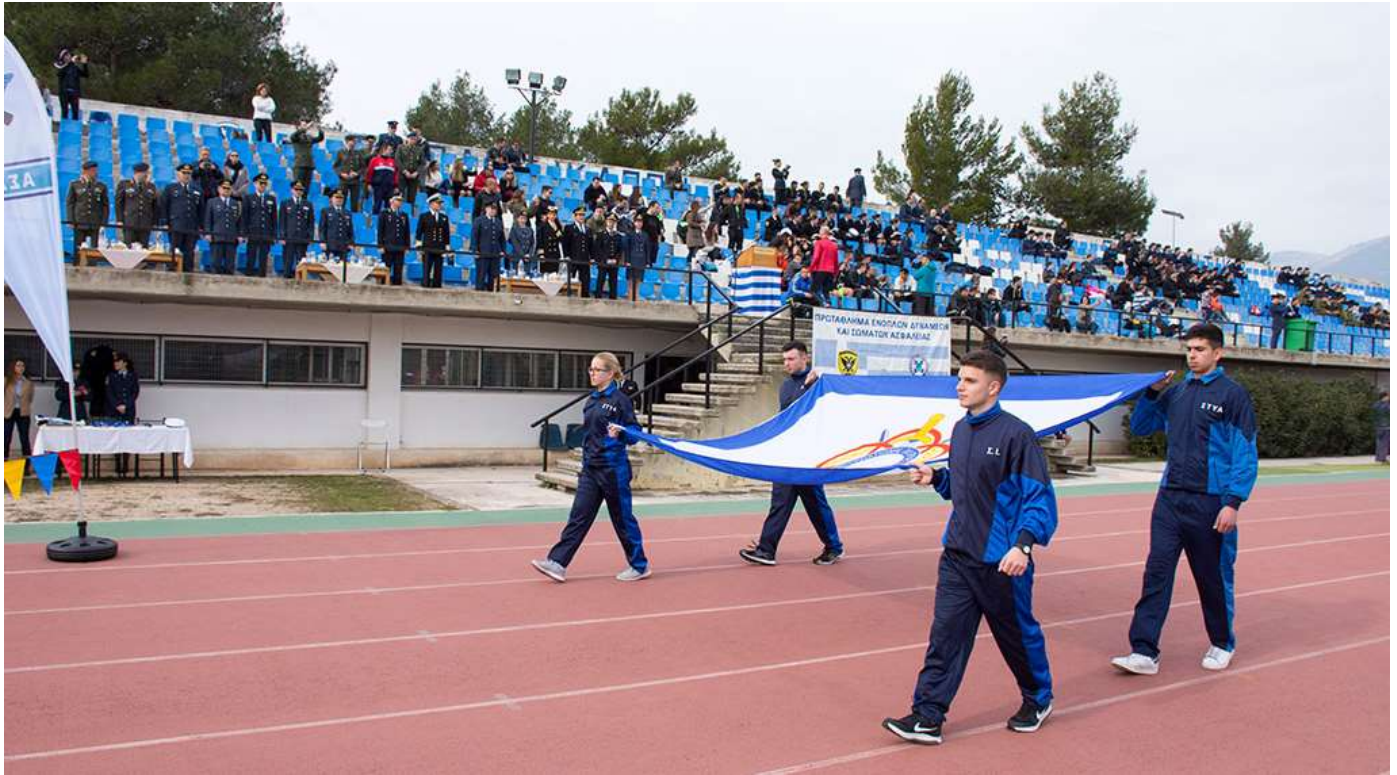
Φωτογραφίες Αγώνων Ανωμάλου Δρόμου - Day Run 2017