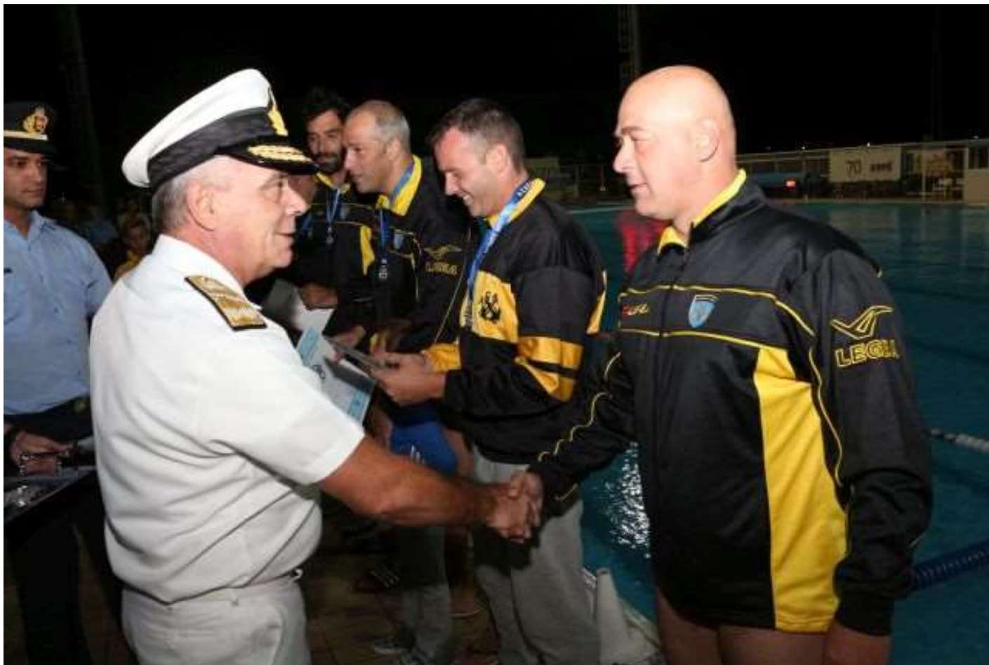
Η ομάδα Υδατοσφαίρισης του Λιμενικού Σώματος – Ελληνικής Ακτοφυλακής κατέκτησε τη 2 η θέση στους αγώνες του αντιστοίχου Πρωταθλήματος των ΕΔ & των ΣΑ 2017

Τέλος, στο πλαίσιο των αρμοδιοτήτων του Γραφείου Αθλητισμού του ΥΝΑΝΠ/ΑΛΣ-ΕΛ.ΑΚΤ, το οποίο προβλέπει την μέριμνα για την οργάνωση και ανάπτυξη της φυσικής αγωγής του προσωπικού Λ.Σ. και των τέκνων του, συνεχίστηκε με μεγάλη επιτυχία κάτω από την επίβλεψη διεθνών αθλητών & προπονητών του ΛΣ-ΕΛ.ΑΚΤ, η λειτουργία προγραμμάτων για την εκμάθηση των εξής αθλημάτων, στα τέκνα του Προσωπικού του ΛΣ-ΕΛ.ΑΚΤ: Ιστιοπλοΐας, Tae Kwo Do, Κωπηλασίας, Καλαθοσφαίρισης, Κολύμβησης και Στίβου.