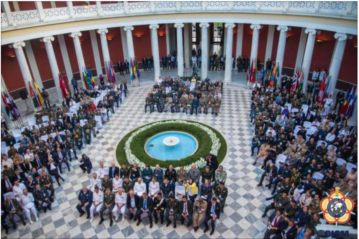
Τελετή έναρξης 72 ης Γενικής Συνέλευσης & Συνεδρίου CISM – Ζάππειο Μέγαρο