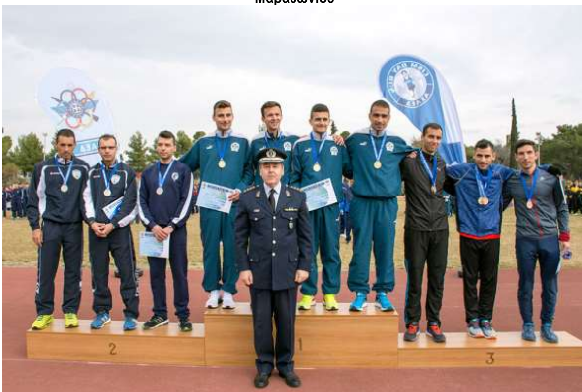
Η Ομάδα Μεγάλων Αποστάσεων της ΕΛ.ΑΣ κατέκτησε την 1 η θέση στην ομαδική κατάταξη του Πρωταθλήματος Ανωμάλου Δρόμου των ΕΔ & των ΣΑ 2017