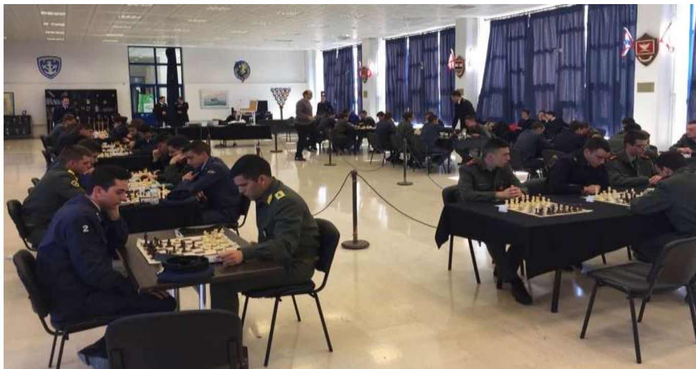
Φωτογραφίες των αγώνων Σκάκι και Καλαθοσφαίρισης των Στρατιωτικών Σχολών των ΕΔ και των Σχολών των ΣΑ 2017