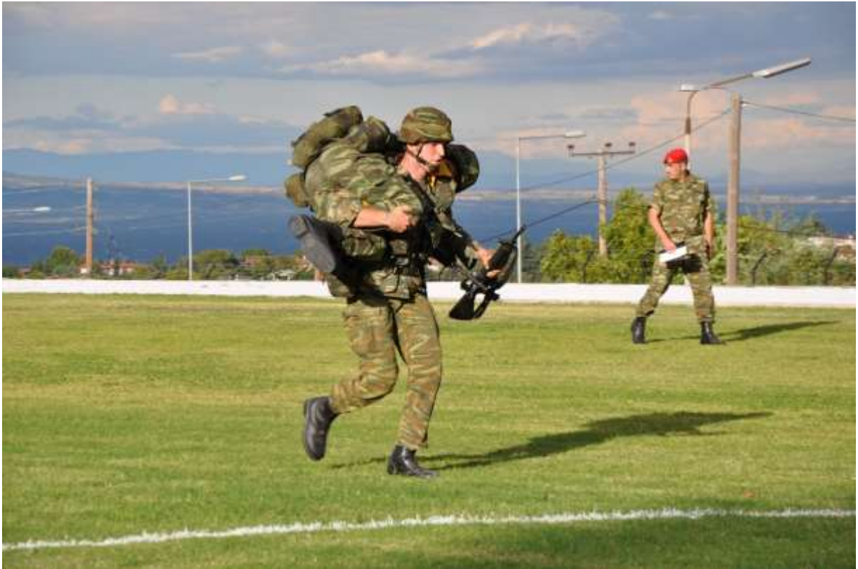
Τρόπαιο 120 Χρόνων Ιστορίας Ι ΜΠ και ΙΙ Μ/Κ ΜΠ»