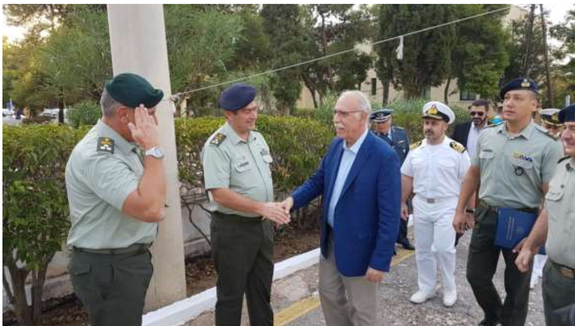
Φωτογραφίες 2 ου Αγώνα Δρόμου Μνήμης & Τιμής Μπλοκ 15 Χαϊδάρη – Καισαριανή

Στον αγώνα συμμετείχαν 360 αθλητές, ανάμεσα τους πολλοί σπουδαστές και σπουδάστριες Στρατιωτικών Σχολών, στελέχη των Ενόπλων Δυνάμεων και των Σωμάτων Ασφαλείας καθώς και ιδιώτες αθλητές και αθλήτριες.