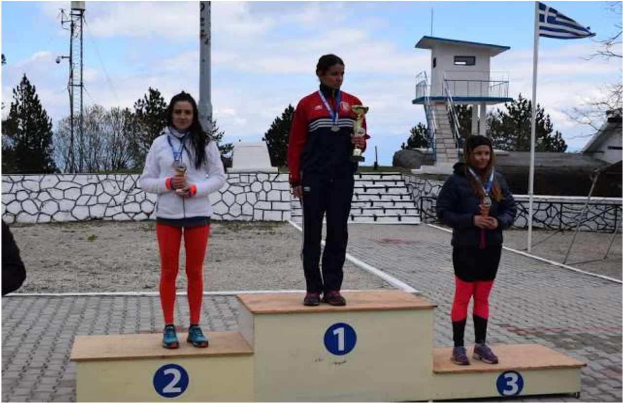
Φωτογραφίες από το «Δρόμο Θυσίας Οχυρών Ιστίμπετη»