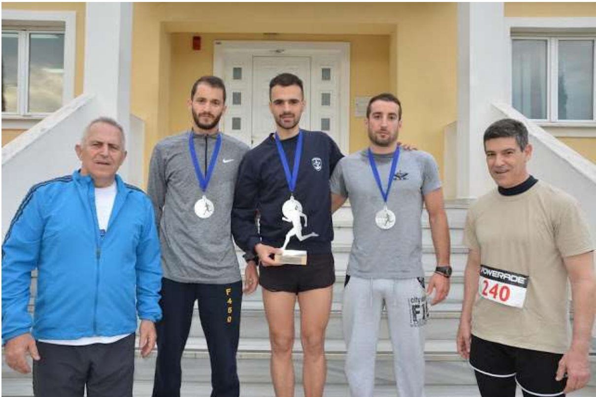
Ο Αρχηγός ΓΕΕΘΑ Ναύαρχος Ευάγγελος Αποστολάκης και ο Αρχηγός Στόλου Αντιναύαρχος Ιωάννης Παυλόπουλος ΠΝ απονέμουν τα έπαθλα στους τρεις πρώτους νικητές / νικήτριες σε αγώνα Δρόμου ΠΝ