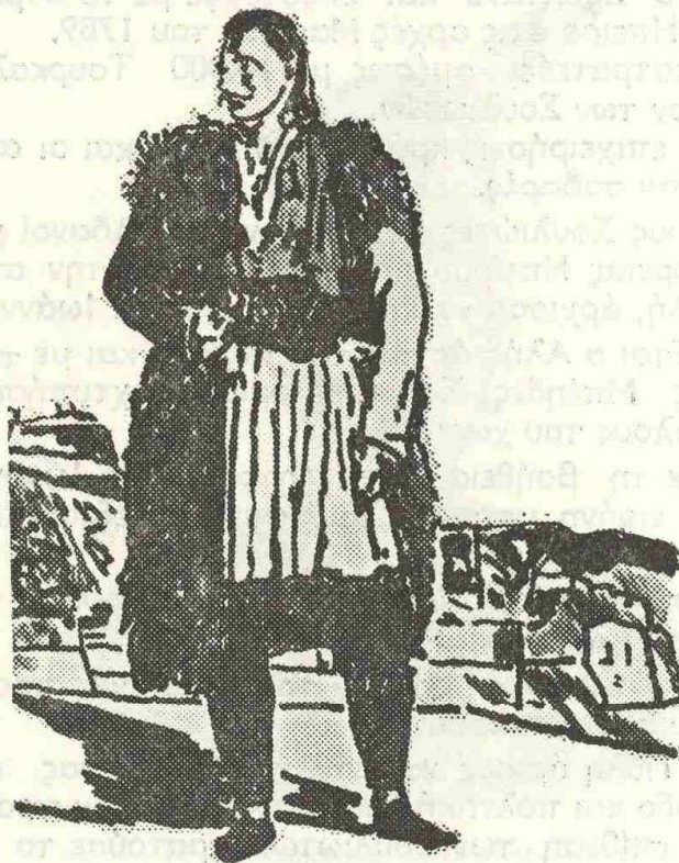
Τύπος Σουλιώτη Αγωνιστή.

Η φήμη των Σουλιωτών ξαπλώθηκε και η συμπολιτεία γινόταν ολοένα και πιο ισχυρή αφού οι Σουλιώτες πέτυχαν 3 ακόμη νίκες, το 1762, 1772, 1775, φέρνοντας σε αδιέξοδο την Πύλη.