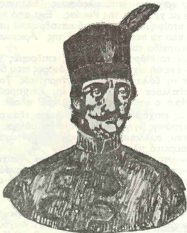
Ο Λάμπρος Κατσώνης

Πήρε μέρος στη δολοφονία του Τούρκου Αγά της Λειβαδιάς σε ηλικία 18 χρονών και κυνηγήθηκε από τους Τουρκαλβανούς που κατέβαιναν στην Πελοπόννησο το 1770.